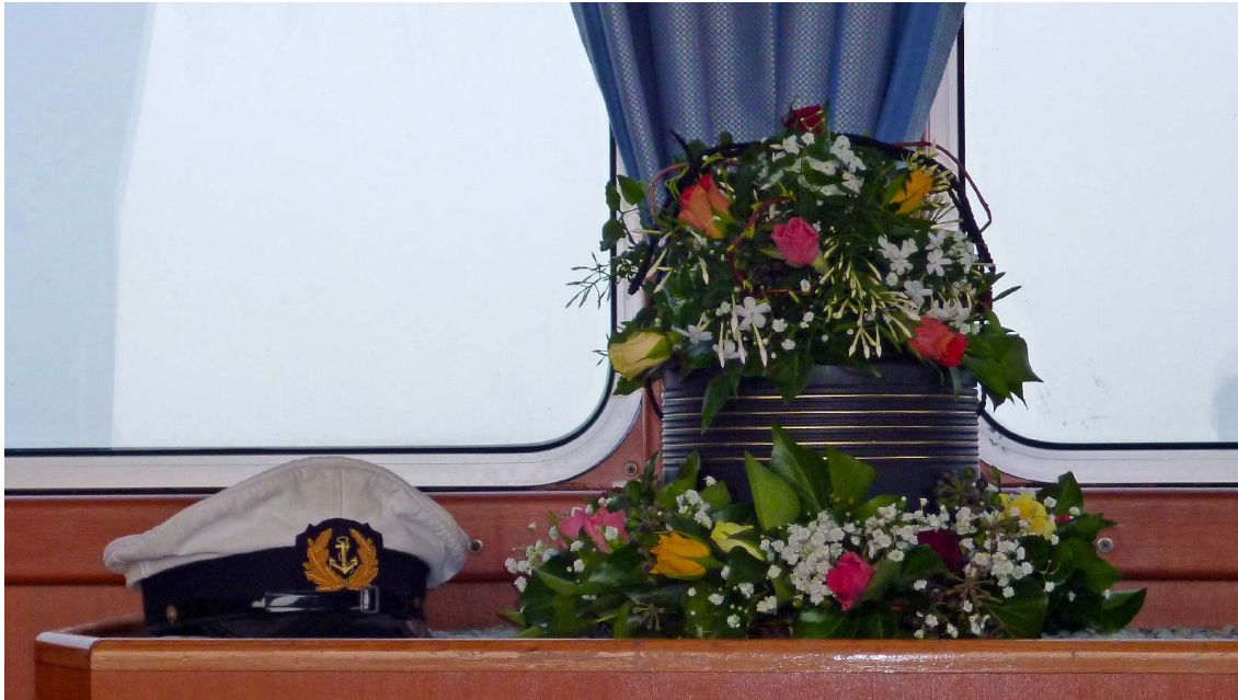
_ Seebestattung - Seeurne

Die Seebestattung stellt eine Ausnahme vom Friedhofszwang in Deutschland dar. Deshalb ist in den meisten Bundesländern eine besondere Ausnahme-Genehmigung notwendig. In Schleswig-Holstein ist die Seebestattung anderen Beisetzungsarten gleichgestellt.